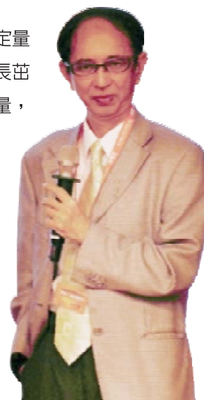
►中央研究院陳仲瑄院士專題演講

綜上，期許本校定量蛋白體中心能逐漸成長茁壯，累積學術經驗能量，航向國際頂尖之路。